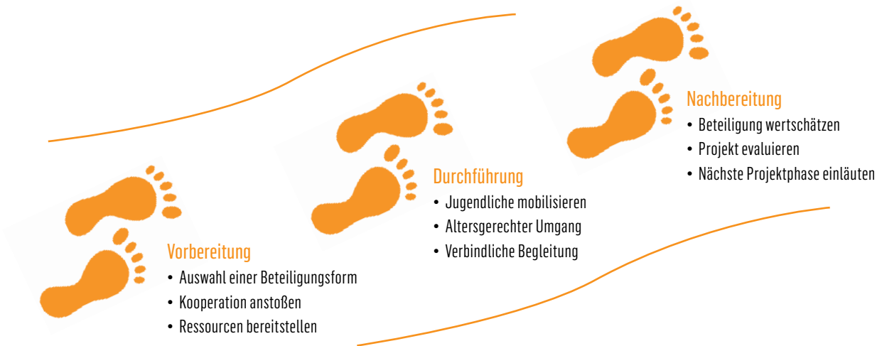
► Abb. 2: Die drei wesentlichen Schritte eines Jugendbeteiligungsprozesses